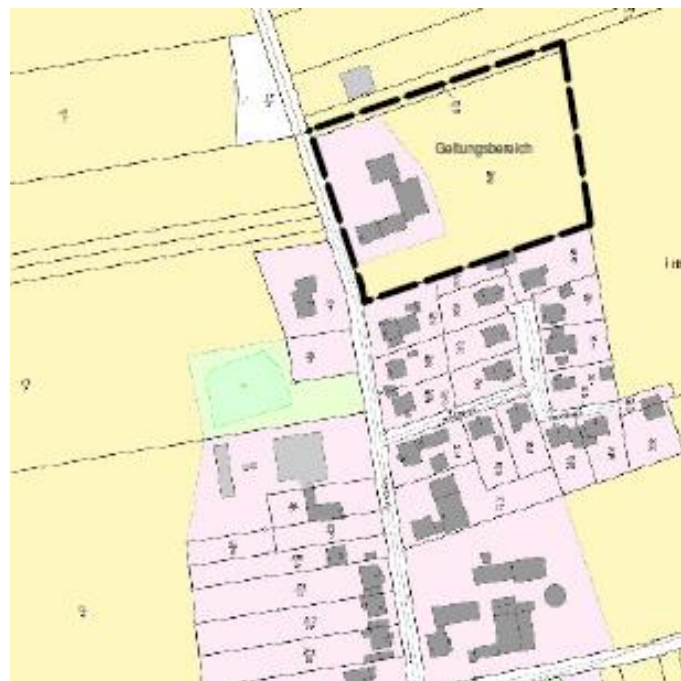
Geltungsbereich M: 1:2.000 im Original

Ziel der Bauleitplanung: Ein privater Investor möchte die Gebäude und die angrenzenden Flächen als betriebliche Einrichtungen für ein Unternehmen für die Durchführung von Arbeiten zur Landespflege und Landschaftsgestaltung nutzen. Darüber hinaus sollen die vorhandenen Gebäude als Wohngebäude dienen.