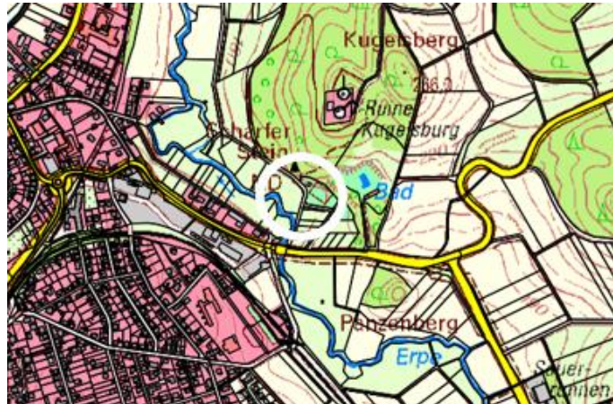
Übersichtsplan: Lage des Geltungsbereichs

Der Geltungsbereich des Vorhabenbezogenen Bebauungsplanes ist in den nachstehenden Kartenauszügen dargestellt.